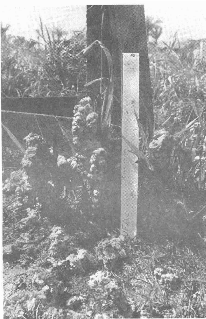
Fig. 2. Montículo de excrementos em forma de torre produzido por Chibui bari.